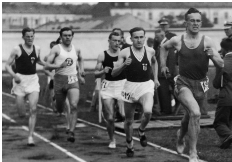
Fot. nr 5. Kazimierz Kuźmicki prowadzi w jednym z ogólnopolskich biegów przed słynnym złotym medalistą olimpijskim – Januszem Kusocińskim.

Natomiast Leon Kozłowski w barwach Legii Warszawa kontynuował w latach 30. swoją medalową passę w Mistrzostwach Polski w rzucie dyskiem.